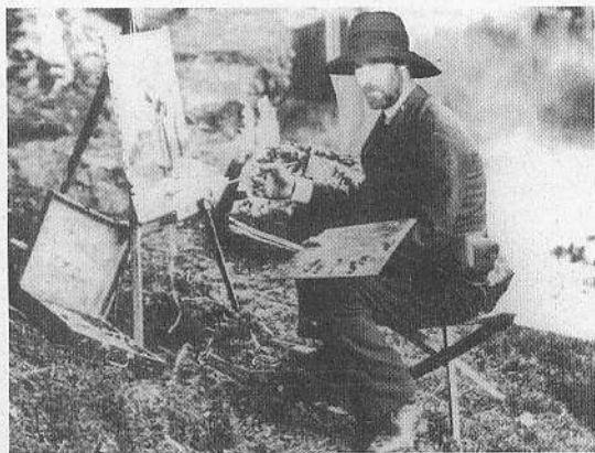
1876 ou 1886 T. Brégenlicht peignant au Bois d'Amour près de Pont-Aven Musée de Pont-Aven

C'est pourquoi, je me suis permis de vous faire parvenir un panier de pommes d'une variété de vous sans doute inconnue, mais très répandue chez moi im Elsass, les Wienachtsaepfel, dont le rouge profond et le brillant si particulier vous inciteront à entamer une nouvelle série de tableaux avec lesquels, soyez-en persuadé, vous étonnerez enfin Paris .