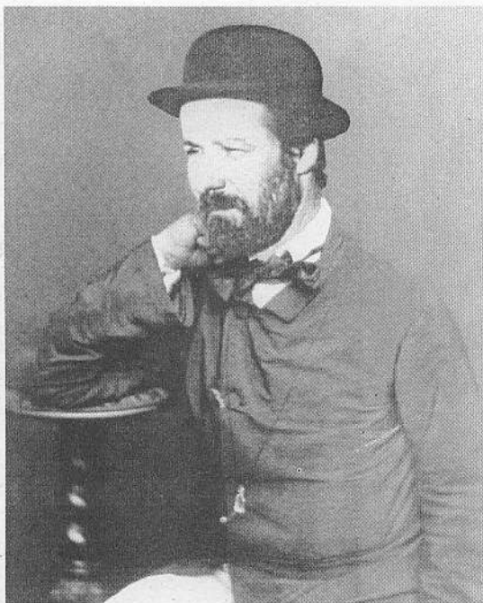
1879 Tarcisse Bregenlicht par Nadar Bibliothèque Nationale

Clément Rimmely Président fondateur de l'Association des Amis des Artistes Alsaciens Oubliés